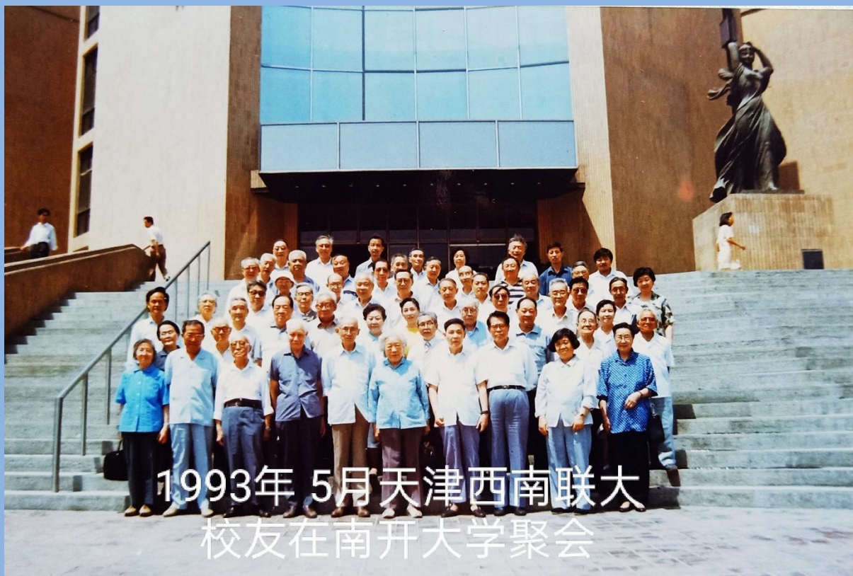
1993年5月天津西南联大 校友在南开大学聚会