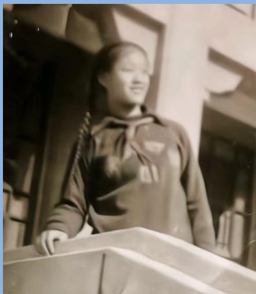
（赛后身着南开女中运动服在天津成都道体育馆）

1965 年在天津市大中学校体操锦标赛中，我以总分 63.9 的成绩，荣获少年组平衡木、自由操、高低杠、跳马等七项个人全能冠军，同时被授予二级运动员证书，为学校争得了荣誉。