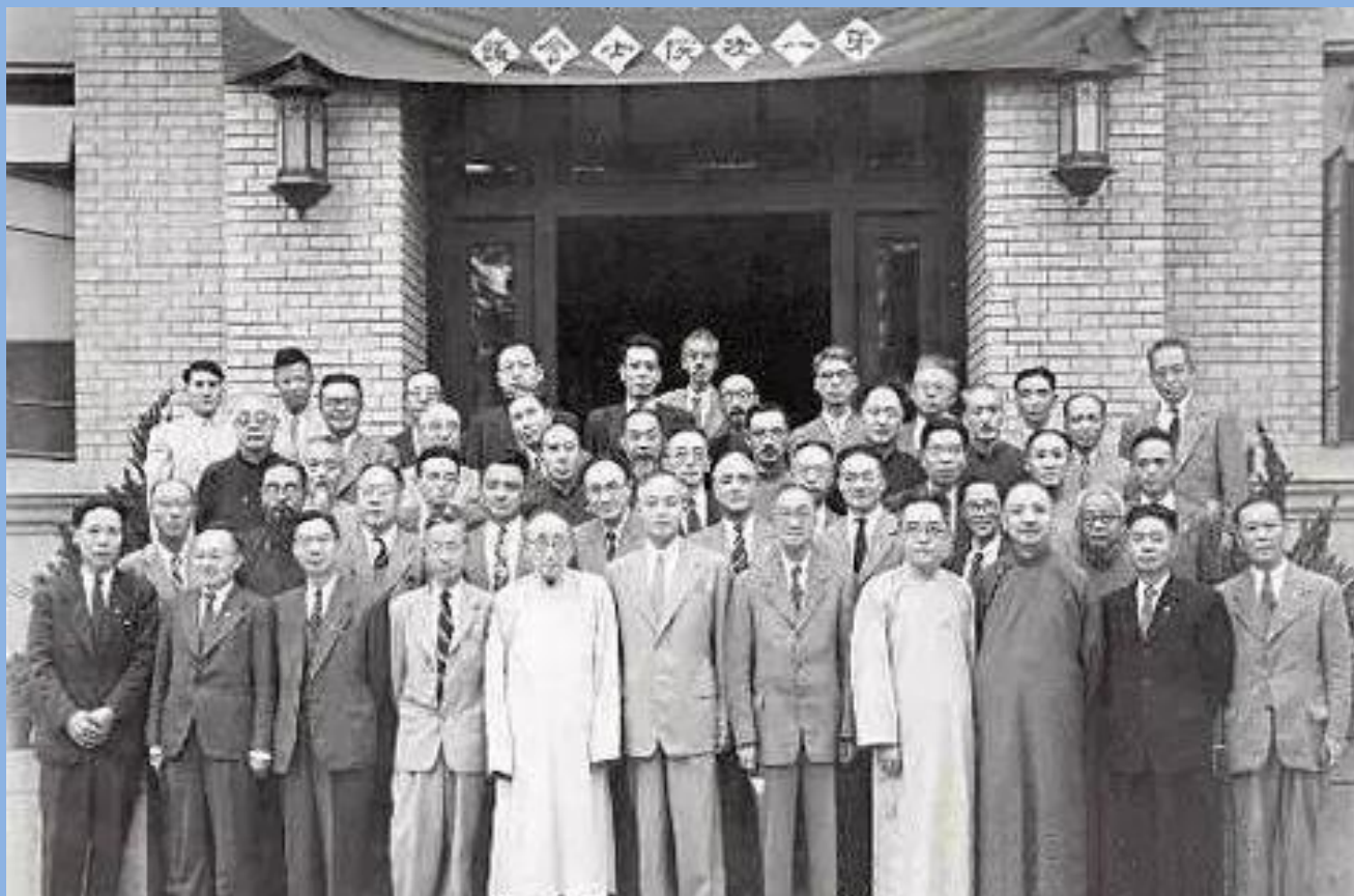
民国中央研究院院士合影。