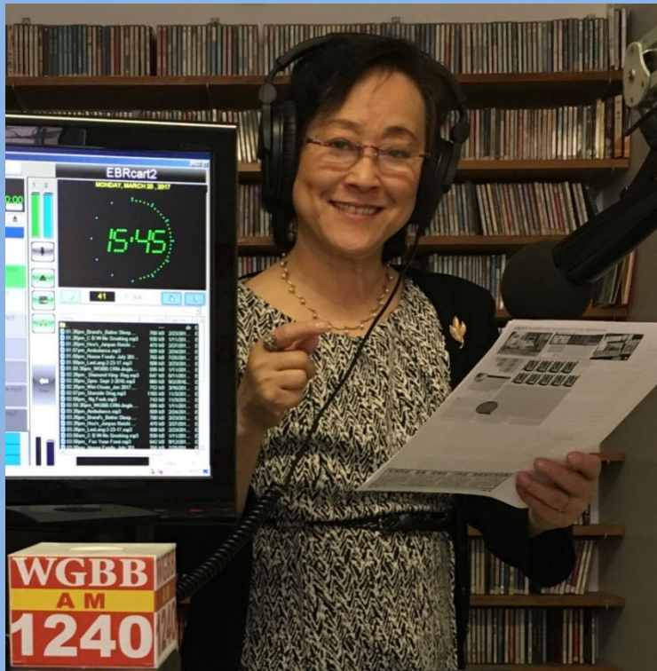
(作者在纽约电台播音室)

2009 年和 2012 年，我在纽约制作的广播节目，两次获得全球华语广播大奖。