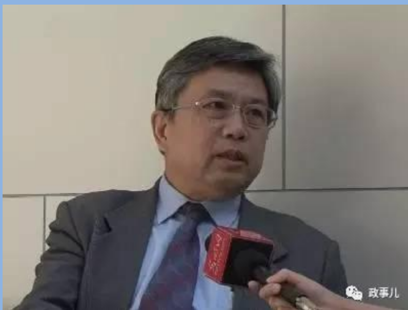
今年全国两会上的龚克

gcxxjgzh新京报时政新闻出品。从小细节说政事儿，解码大时政背后的隐逻辑。中国科研论文数量多质量少？高校“近亲繁殖”现象严重？行政化观念浓厚？……围绕这些问题，全国两会期间，“政事儿”（微信ID：gcxxjgzh）独家专访了全国人大代表、南开大学校长龚克。