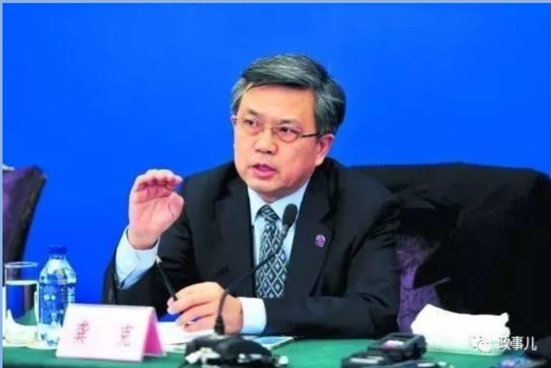
龚克在2014年全国两会上

“政事儿”：包括南开在内，有很多院校存在“近亲繁殖”现象（老教授的学生、乃至学生的学生都进入教学岗位），如何解决这一问题？