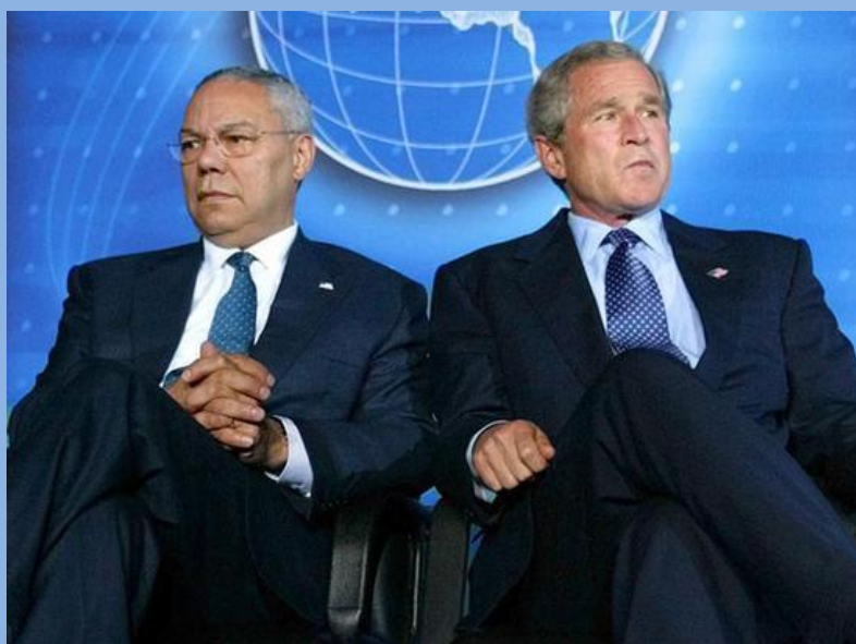
鲍威尔和小布什。 图自美媒 →

在外交策略上，鲍威尔强调多边主义和以外交手段解决对外关系，被认为是小布什内阁中的"鸽派"。由于小布什倾向于支持以拉姆斯菲尔德(前美国国防部长)为首的"鹰派"的主张，鲍威尔在对外政策上受到极大掣肘，遂于2004年底宣布辞去国务卿一职。