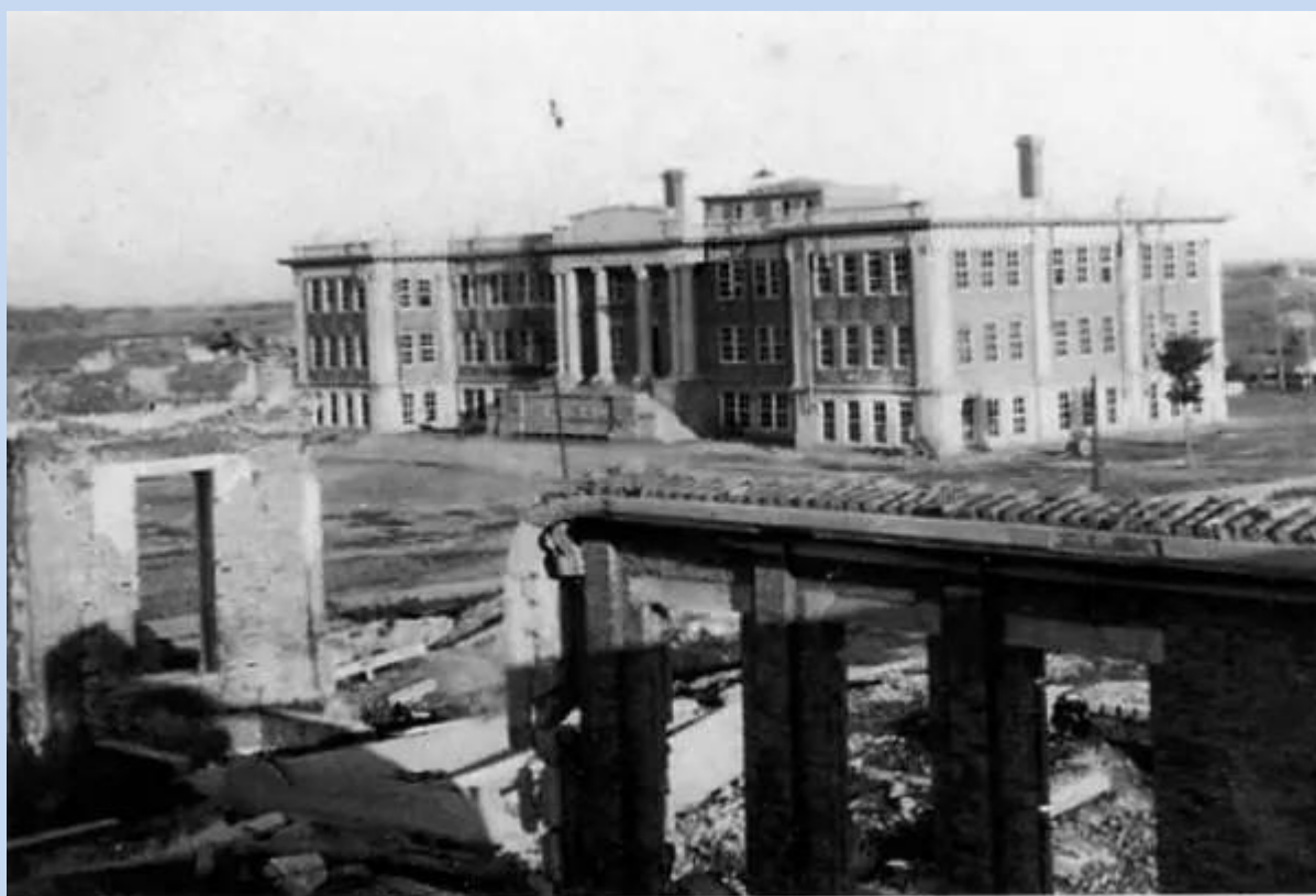
南開大学爆撃跡爆撃跡の思源堂