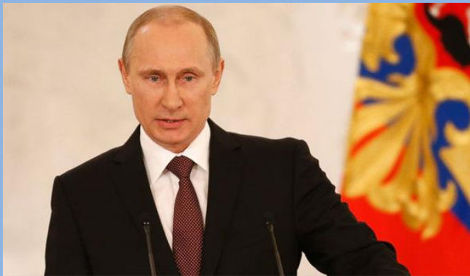
Russian president Vladimir Putin welcomed members of the "Republic of Crimea."

Russian President Vladimir Putin is the man Western officials and media have loved to hate. But Putin has always wanted to be part of the West. It was the West -- the United States and NATO that drove him into a corner. "If you press a spring too hard" as Putin put it, "it will recoil."