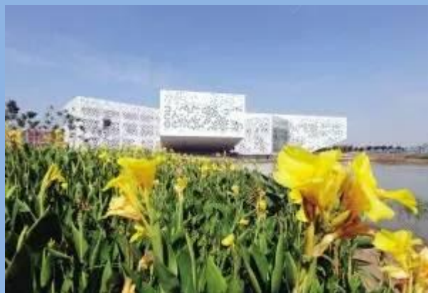
新校区大学生活动中心，像海棠花坐落于湖上

今后，南开大学新校区将慢慢走进南开大学师生的生活中。多年以后，新校区的这些标志性建筑，依然会让你依依不舍。