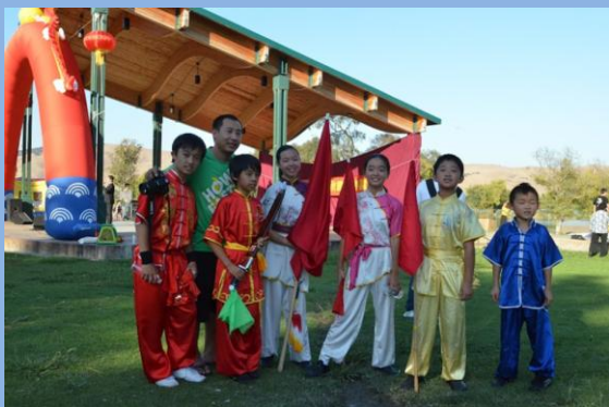
向日葵文武学院的师傅和表演者