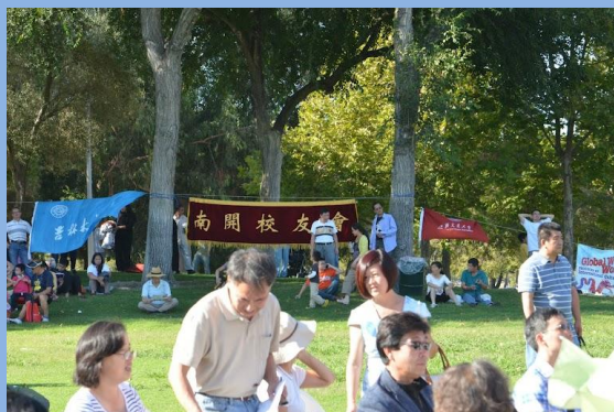
“硅谷情，中国心”中秋国庆联欢会现场