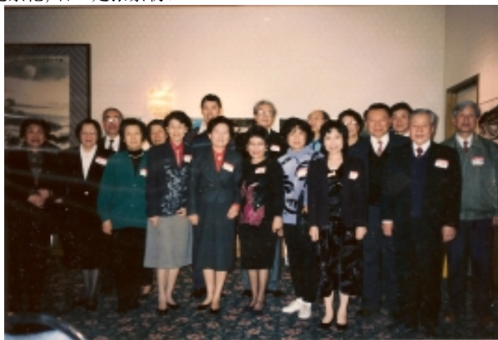
图三 第六任梅平总领事邀请各大学校友会在总领馆聚会。图为与会南开校友们合影。