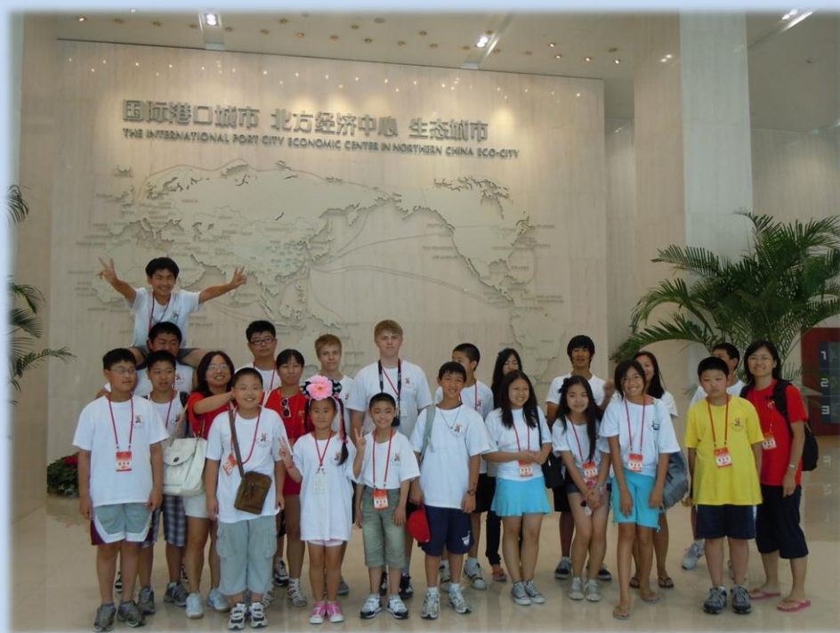
营员们在天津规划馆合影

从北京一进天津卫的大门， 我们被引进了城市规划馆。作为一个土生土长的天津人，我都从没有这样系统地、形象地了解天津的历史，现在和未来。对于从小就长在海外的营员们来说，这更是一个最良好的启蒙。俗语讲，好的开始是成功的一半。我对天津营的活动充满信心。