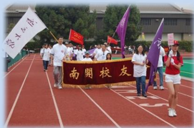
南开大学校友会运动员入场

2010 年 8 月 14 日上午九時开始，北加州华人文化体育協會在东西湾联合市田徑田徑场举行“激情盛会和諧僑社 APAPA 运动大会”，有 127 支來自兩岸三地的海外华人所組成的隊伍參加數十項的比賽，开幕式極為壯觀，有一万多來自湾区各侨团選派运动员及观众親臨現場，这是海外华人展现团结、进步、和諧、表達炎黄子孫是一家的盛会。华体会促進全民健身，團結一致，好漢當自強。祝华体会一年比一年好！祝华体会圓滿成功！再创辉煌！