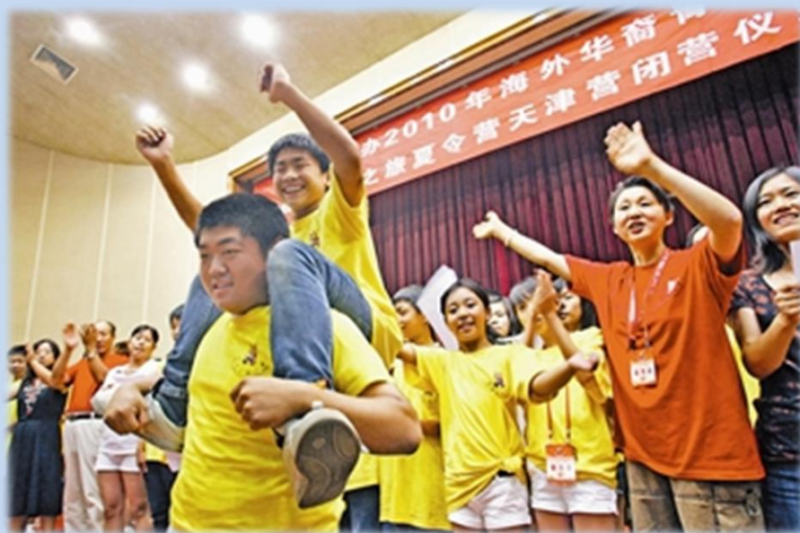
南开校友下一代在闭幕式上已经不分你我。