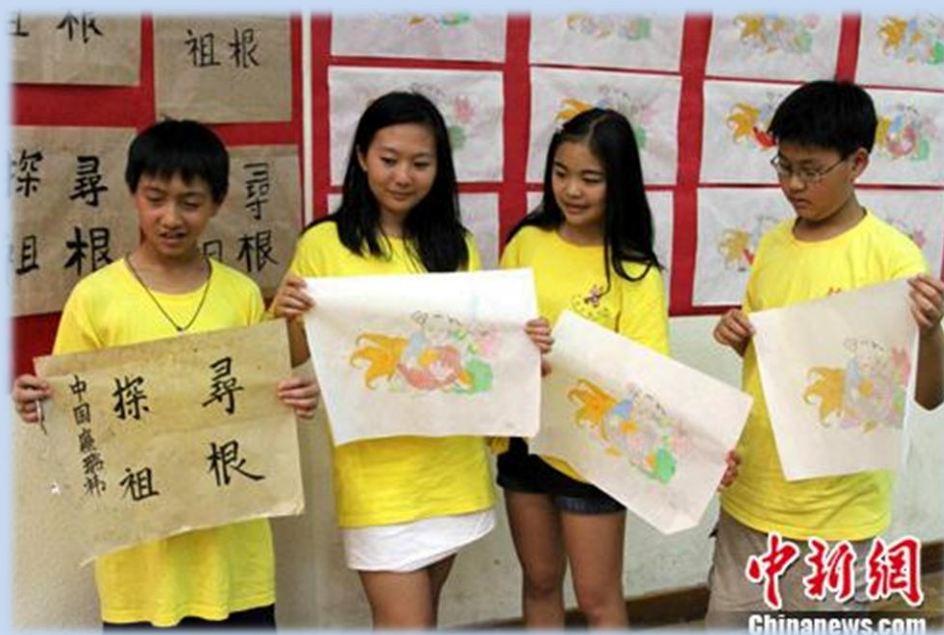
几位美国小营员展示自己在夏令营中的书法、绘画作品。

没有不散的宴席。晚宴后，有些孩子已陆续离开。泪水满面的女孩子被家长接走的时候，我们领队也禁不住泪水夺眶而出。人的情感很难用时间来衡量。每一次牵挂，每一次叮嘱已经不再是悬念。多少次我期待着把孩子安全交给家长的一刻，此时却被一种不可割舍的感觉取代。