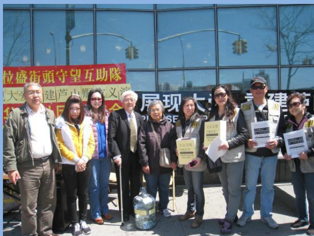
众多法拉盛守望队员积极参与赈灾募捐