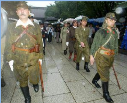
2003年8月15日，披挂二战期间日军装束的右翼分子

必要互相争夺，国与国之间应当互相帮助，和平共处。以强凛弱，弱肉强食是错误的，绝不能允许法西斯军国主义死灰复燃，人类的发展应当走和平发展的道路。