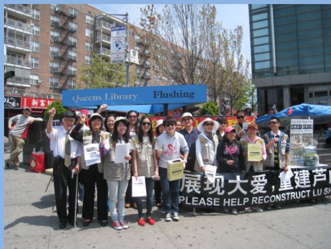
展现大爱 重建芦山