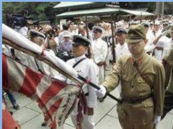
日本军国主义幽灵再现