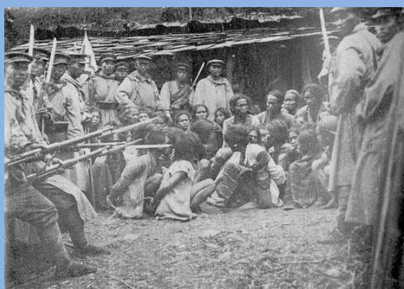
当年旧照，日寇屠杀台湾人民。

1895年7月22日，日寇在台湾桃园县大溪下令焚燒大溪的街道，連續燒了3天燒毀房屋1500多戶，台湾人死傷260人；1895年9月2日，日本人到達嘉義縣大林，大林人決定放棄抵抗，掃路、供食歡迎日軍。沒想到日本人竟然要求獻出200名婦女，被拒後，日本人姦殺婦女60多人；1895年10月10日，日寇登陸到達台南縣，近萬村民躲到溪邊，嬰兒哭聲被發現，日寇連續開槍，大人、小孩、嬰兒全被打死；1896年6月16日，日寇進攻雲林地區屠殺七天，4295戶民宅被燒毀，殘殺老百姓6000人；又如霧社