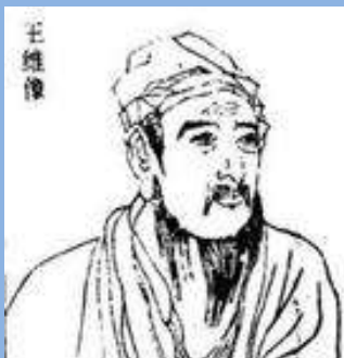
唐诗 作者 王维